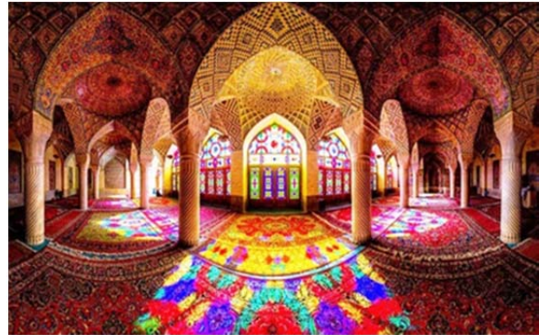
شکل ۴) نمایی از مسجد نصیرالملک؛ شیراز، ایران