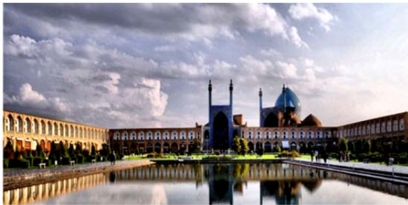
شکل ۱) احساس فضا، همیشه با زمان و مکان در ارتباط است؛ میدان نقش جهان، اصفهان، ایران

ذهنی از فضا بینجامد. این عینیت قابل ادراک بر مبنای محرک‌های حسی و تجربیات شخصی و قومی و جمعی و چارچوب‌های فرهنگی و قضاوت‌های زیبایی‌شناسی و ارزش‌ها و ایده‌آل‌ها و آرمان‌ها ادراک می‌شود و نهایتاً تصویر ذهنی در ذهن ناظر شکل می‌گیرد. قابلیت ایجاد تصویر ذهنی از فضا در ذهن انسان، قابلیتی موجود در فضای معماری است که می‌تواند به ایجاد حس مکان بیانجامد. معماری یعنی خلق و سامان‌دهی فضاها، فضاهایی که ممکن است هر کدام القاکننده حالتی خاص در مخاطب خود باشند. منتهی مساله‌ای که در مورد درک از فضاهای معماری مهم می‌نماید این نکته است که بیشترین درک از فضای معماری به‌وسیله چشم صورت می‌گیرد البته نقش سایر حواس هم در درک برخی از فضاها اهمیت دارد. معمار یک بنا ایده‌ای خاص را در سر می‌پروراند و برای اینکه بتواند این ایده را به تصویر بکشد نیاز به خلق فضا دارد. و این فضای اوست که تعیین می‌کند کدام دیوار از چه نوع مصالحی و به چه رنگی در کجای فضای او ظاهر شود. شاید خیلی از مردم به غلط این برداشت را داشته باشند فضای معماری را دیوارها، ستون‌ها و سقف‌هایی که محصورش کرده‌اند به وجود آورده است. در صورتی که این برداشت نسبت به فضای معماری کاملاً غلط است چون همان طور که در پیش‌درآمد ذکر شد این ماهیت فضا است که تعیین می‌کند کدامین عنصر در کجا قرار گیرد.