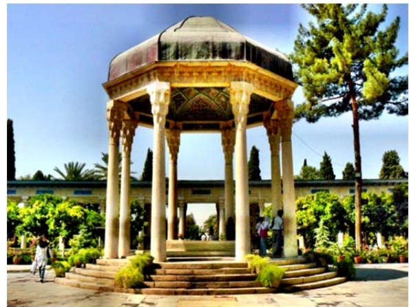
شکل ۲) آرامگاه حافظیه؛ شیراز، ایران

معماری از دیرباز به انسان کمک کرده است که وجود خود را معنادار کند. انسان به مدد معماری پایگاهی در فضا و زمان به دست آورد، پس به امری فراتر از نیازهای عملی و اقتصادی متوجه است و به معانی وجودی توجه دارد؛ معانی وجودی از پدیده‌های طبیعی و انسانی و معنوی نشأت می‌گیرد و در قالب نظم و شخصیت به ادراک درمی‌آید. هم از این روست که معماری این معانی را به‌صورت‌های فضایی تجربه می‌کند. صورت‌های فضایی در معماری نه اقلیدسی است نه آینشتاینی. بلکه یعنی مکان و معبر و حوزه؛ به عبارت دیگر، ساختار ملموس محیط انسان. پس معماری را نمی‌توان از راه مفاهیم هندسی یا نشانه‌شناسانه به‌درستی تبیین کرد. معماری را باید در چارچوب صورت‌های معنادار (نمادین) فهمید. بدین لحاظ، معماری بخشی از تاریخ معانی وجودی است. به زعم شوئر امروزه انسان سخت نیازمند آن است که "معماری چون پدیده‌ای ملموس را دوباره فراچنگ آورد" [23] . هوسرل معنا را در منطق استوار می‌سازد و بیان (معنا) را مستقل از ارتباط نشانه‌ای تصور می‌کند؛ اما به عقیده دریدا، میان معنا (بیان) و نشانه‌های آن نوعی درهم‌تنیدگی ذاتی وجود دارد. معنا هرگز نمی‌تواند مجرد از بافت زبان شناختی، نشانه‌شناختی و تاریخی‌اش در نظر گرفته شود. این بافت‌ها نظامی از ارجاع است که به فراسوی خود حضوری معنا اشاره دارد و سعی در نشان‌دادن پیوند ذاتی نشانه و معنا دارد [24] (شکل ۲).