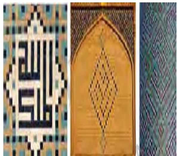
تصویر شماره ۳: کاشی معقلی با خطوط کوفی بنایی

واژه مسجد در لغت به معنای جایگاه سجده و محل عبادت است. مسجد از همان آغاز، علاوه بر اینکه به عنوان جایگاه اصلی اجتماع مؤمنین برای ادای فرایض دینی مورد استفاده بود، کانون فعالیت های اساسی نهضت جهانی اسلام نیز به شمار می رفت و در واقع پایه های حکومت اسلامی در این مکان بنیانگذاری شد. در ایدئولوژی اسلام به عنوان یک دین کامل، مسجد به عنوان کانون مشترک عبادی-سیاسی پایه گذاری شده است، بیشتر امرا و فرمانروایان کشورهای اسلامی که خود را خلیفه الله هم می دانستند بر آن بودند که کاخ های سلطنتی و دارالاماره را نزدیک مسجد اصلی شهر بنا کنند تا به مسجد نظارت داشته باشند. بهترین مسجد شهرهای بزرگ، مستقر در مرکز شهر را مسجد جامع می نامند. معمولا مساجد جامع از مهمترین آثار معماری شهر به شمار می آیند.