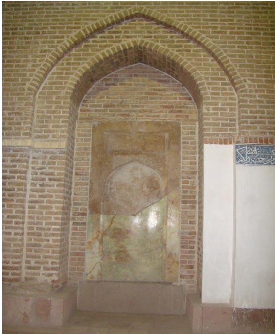
تصویر شماره ۷: ماهنامه الکترونیکی بهارستان ماهنامه شماره ۱۰۱ - صفحه ۴

آنچه در ابتدا به چشم ناظر می خورد، بزرگی و پهنای سردر است که با دیگر قسمتهای بنا هماهنگ نیست. ارتفاع سردر دو برابر پهنای آن است اما خطای چشم در ارزیابی عمودی و افقی آن را مرتفع تر و بلندتر نشان می دهد. سردر با ویژگیهای خاص خود به سه قسمت تقسیم شده است؛ دو پایه بزرگ که طاق ضربی روی آنها زده شده و در وسط دو پایه محل استقرار درب ورودی است. حاشیه طاق سردر را ستون مارپیچی ممتد تشکیل می دهد. همه هنرها در کار تزیین این سردر به کار گرفته شده است. (تصویر شماره ۵)