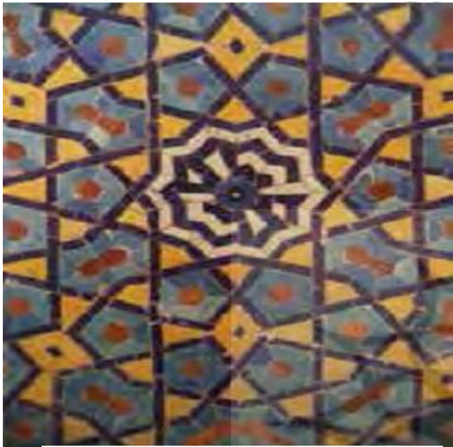
تصویر شماره ۱: کاشی معرق (علوی، ۲۰۲، ۱۳۹۰)

مربوط به مسجد میدان کاشان است که امضای استاد حیدر کاشی تراش در بخشی از آن دیده میشود. معرق کاری در دوره صفویان رواج داشته است. (تصویر شماره ۱)