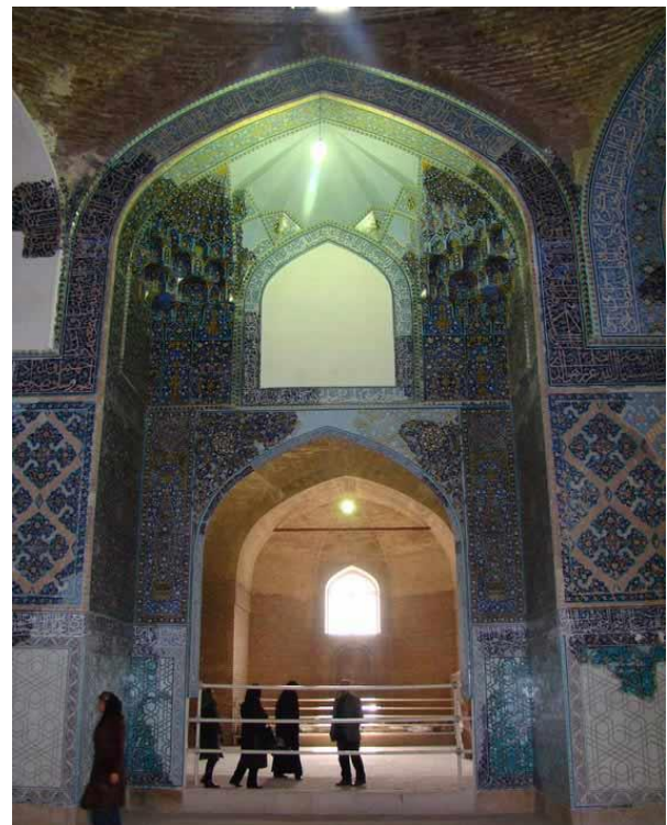
تصویر شماره ۶: ماهنامه الکترونیکی بهارستان ماهنامه شماره ۱۰۱ - صفحه ۴

اصلی مسجد به پا شده که محوطه ای محصور، پوشیده و مربع شکل است. فاصله پایه های سقف ضربی آن، ۱۲ متر است که بر روی چهار پایه یک محوطه مربع شکل قرار دارد. بالای این بنا گنبدی قرار داشت که از آجر ساخته شده بود، که ریخته است. تزیینات دل انگیز و زیبایی متنوع به داخل مسجد اختصاص دارد. کف مسجد کاشیهای براق داشت.