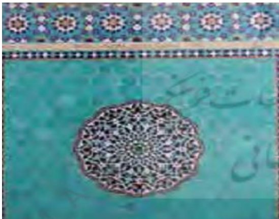
تصویر شماره ۲: کاشی هفت رنگ

کاشی هفت رنگ که شهرت بسیاری دارد از کاشی های خشت یعنی چهارگوش نشات گرفته و اندازه آن ۱۵ در ۱۵ سانتی متر است که در کنار یکدیگر قرار می دهند و نقش مورد نظر را روی آن رنگ آمیزی میکنند و به کوره برده، حرارت می دهند تا لعاب پخته شود. هفت رنگ متداول عبارت است از سیاه، سفید، لاجوردی، فیروزه ای، قرمز، زرد وحنایی که در ابنیه تاریخی و اماکن متبرکه از این نوع کاشی ها زیاد استفاده شده است. (تصویر شماره ۲)