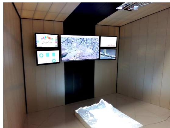
شکل ۲ : رصد خانه مدیریت شهری (شارنما) - نمونه آزمایشی ساخته شده توسط شرکت شهرسازی ارگ آفرین

شارنما یا رصد خانه مدیریت شهری ، فن آوری است که جهت مدیریت دانش بنیان و هوشمندانه شهر ها پدید آمده است ، این تکنولوژی در ۲۰۰ شهر از ۵۴ کشور دنیا مورد استفاده قرار گرفته و تحت برنامه های مرکز اسکان بشر سازمان ملل متحد "هیتات" نیز پیگیری می شود ، این تکنولوژی در سه بخش پیاده سازی شده است ، بخش نخست "بانک جامع اطلاعاتی" نام دارد که مرکزی برای جمعیت طبقه بندی و تحلیل داده های شهری است . بخش دوم "نبض شهر" که به بررسی و کنترل شاخص های کیفیت زندگی سازمان ملل در سه سطح محلی ، ملی و بین المللی و در سه بعد کالبدی ، مدنی و افکار سنجی مردمی می پردازد و بخش سوم "پایش طرح های توسعه شهری" است که به کنترل هوشمند و سه بعدی اجرای طرح های توسعه شهری ، نظیر طرح های جامع ، تفصیلی و از همه مهمتر CDS می پردازد . در این بخش با بهره گیری از روش های علمی سنجه هایی برای سنجش میزان تحقق هر یک از اهداف و برنامه های تعریف شده در طرح در نظر گرفته می شود و سامانه با بهره گیری از اطلاعات جمع شده در بانک جامع اطلاعاتی به پالایش داده ها می پردازد و زمینه را برای تحلیل های بعدی و ارائه نقشه های دو بعدی و سه بعدی به مدیران شهری فراهم می آورد .