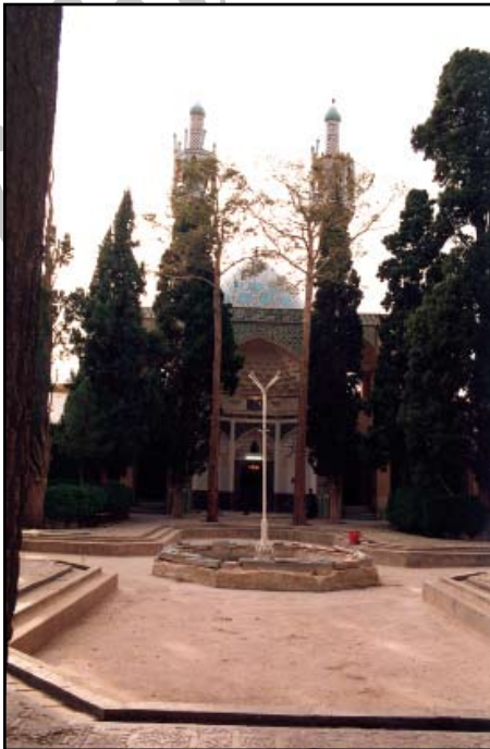
" ···· ···· :èè