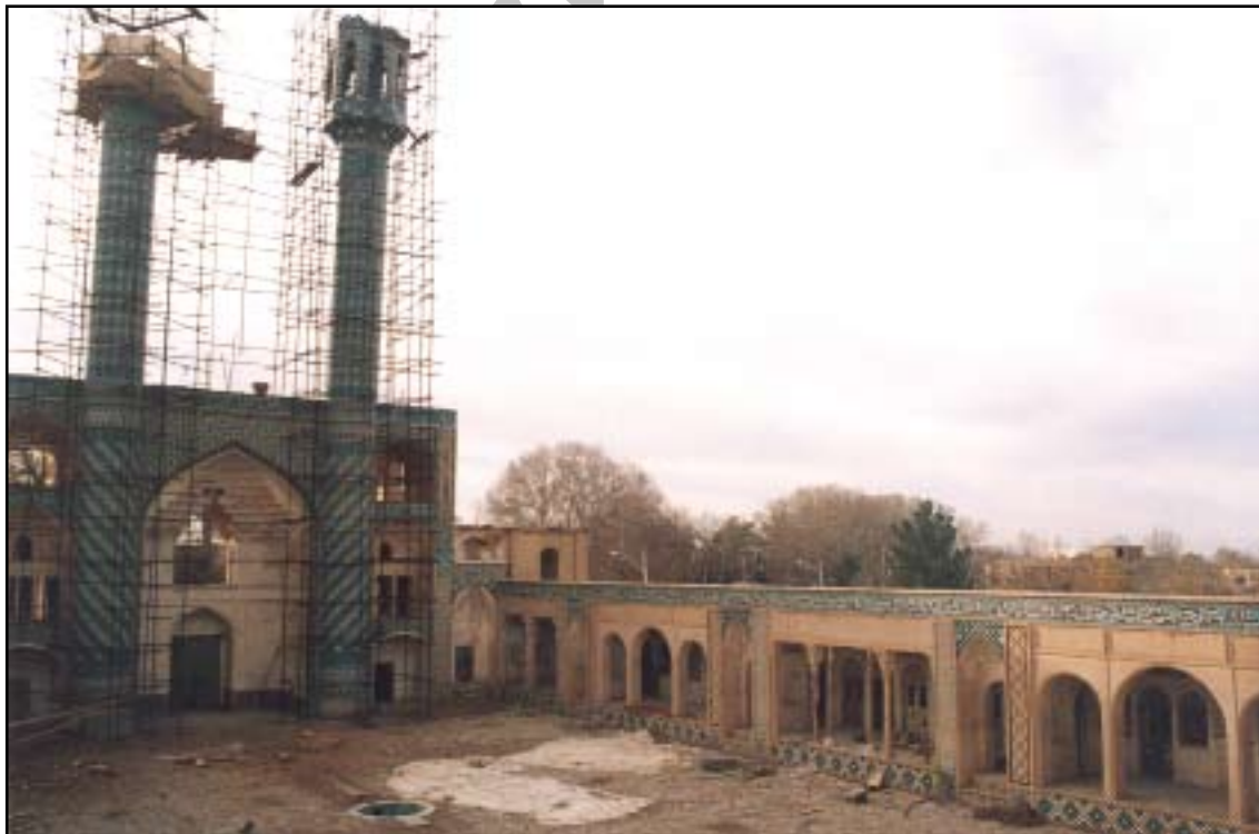
شماره ۱۳ - منظر بیرونی مسجد