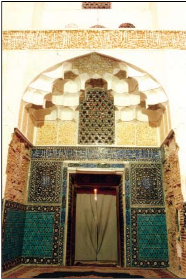
شماره ۱۱ - منظر داخلی مسجد