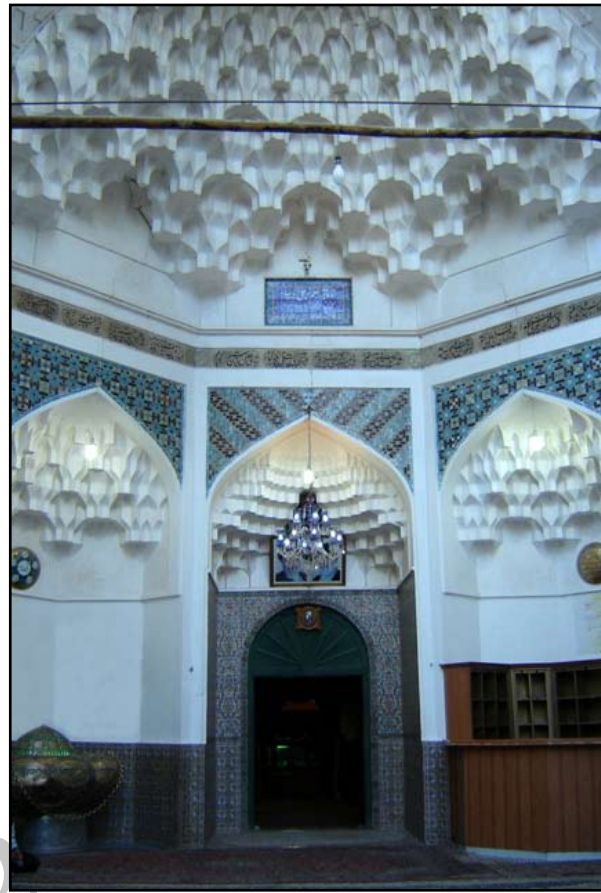
شماره ۱۲ - منظر داخلی مسجد