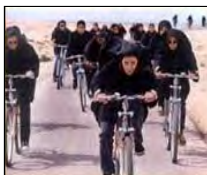
اشباع فضاهای شهری با رنگ سیاه پوشش زنان

جامعه ما همواره با این مشکل اجتماعی دست و پنجه نرم کرده و میکند. تداوم این مشکل، جامعه ایرانی را با مشکلات کلان تری روبرو خواهد کرد. فضاهای شهری نمود مدنیت و دموکراسی و هویت شهرها و همچنین محل شکل گیری