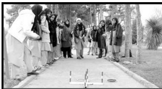
نمونه آشکار زنان در حصار فرهنگی جامعه