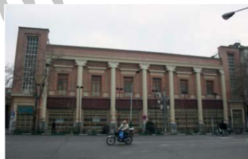
تصویر شماره ۲۴: ساختمان شرکت سهامی فرش (منبع: نگارندگان)

بازگشت وی به اروپا توسط وارتان هوانسیان ۱۷ (دیگر معمار ارمنی تبار) به اتمام رسید. این ساختمان که ساختاری متقارن با ترکیبی سه‌گانه را نشان می‌دهد، ساختمان سه طبقه طولی است که از یک جز میانی و دو جز کناری تشکیل شده است. معمار به کمک مجموعه‌ای از حجم‌های جلو آمده بر قسمت میانی تأکید می‌کند. این مجموعه متشکل از مکعب مستطیل‌های عمودی تو در تو است و در مرکز آن در داخل یک عقب‌نشینی در ورودی اصلی ساختمان قرار دارد. جزءهای کناری ساختمان را معمار به صورت محاط در مربع در نظر گرفته و در مرکز آن حیاطی قرار داده است. ضلع شمالی ساختمان بر امتداد مایل خیابان فروغی منطبق است. و اختلاف مشهود بین اجزای شرقی و غربی ساختمان به دلیل تغییراتی است که در ضلع شرقی ساختمان در چند سال گذشته رخ داده است و ارتباطی با طرح اولیه ندارد.