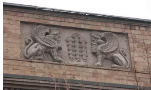
تصویر شماره ۹: نقش برجسته (گریفین و گلپای نیلوفر به صورت قرینه) به کار رفته در بنای وزارت امور خارجه با تقلید از نقش برجسته‌های هخامنشی