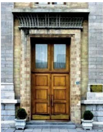
تصویر شماره ۵: نعل درگاه بالای در ورودی در ساختمان وزارت امور خارجه با تقلید از کاخ داریوش در تخت جمشید