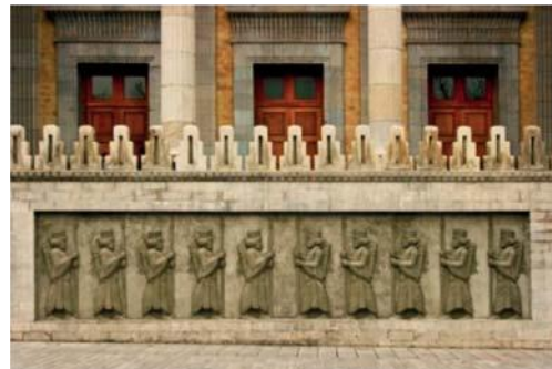
تصویر شماره ۷: عناصر تزیینی (نقوش برجسته، کنگره‌ها) به کار رفته در بنای در وزارت امور خارجه (کاخ شهربانی سابق)

صنعتی بودند، برای اولین بار با نوعی انتخاب تاریخی رو به رو شدند. آنان باید می‌فهمیدند که از چه دوره، چگونه و به چه مقدار انتخاب کنند» (صارمی و رامرد، ۱۳۷۶: ۱۴۵).