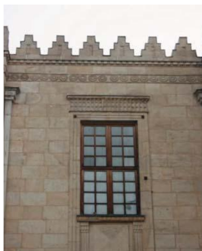
تصویر شماره ۳: نعل درگاه پنجره و کنگره‌های بام در تقلید از بنای بانک ملی