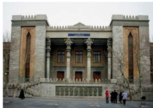
تصویر شماره ۱۴: کاخ شهربانی (وزارت امور خارجه فعلی) ۱۳۱۵ هـ.ش استفاده از پلکان دو طرفه، سرستون‌ها، کنگره بام، نقش برجسته‌ها و نعل درگاه‌ها تقلید مستقیم از تخت جمشید هستند