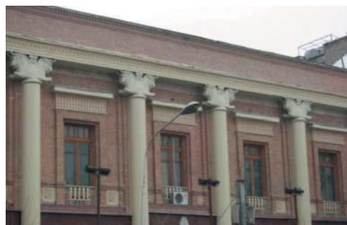
تصویر شماره ۲۳: استفاده از عناصر معماری هخامنشی نظیر: سرستون‌های گاو شاخدار و نعل درگاه بالای پنجره‌ها (منبع: نگارندگان)

از ویژگی‌های این بناها، ایجاد ایوان‌های عظیم و مرتفع در محل ورودی و مرکزیت بنا با ستون‌ها و سرستون‌هایی تزیین شده در جلوی آن‌هاست. همچنین استفاده از پلکان‌هایی که به این ایوان‌ها ختم می‌شوند و پنجره‌ها و قاب‌بندی کنگره‌های بام و در حاشیه پلکان‌ها که جملگی از ویژگی‌های کاخ‌های دوره هخامنشی ایران است. همچنین باید اضافه کرد که کلیه بناها به شکلی متقارن و مرتفع که حاکی از عظمت و قدرت هستند، شکل گرفته‌اند (پاکدامن، ۱۳۷۶).