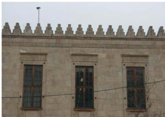
تصویر شماره ۱۵: کنگره های بام، نعل درگاه بالای پنجره‌ها و تزیین‌های گل نیلوفر با تقلید از معماری هخامنشی در بنای بانک ملی (منبع: نگارندگان)

۱۳۰۰ تا ۱۳۱۰ هـ.ش ساخته شد. این بنا را می‌توان تلفیقی از معماری باستانی ایران در دوران هخامنشی و معماری باروک اروپا دانست که کلیساهای اروپایی از بارزترین نمونه‌های آن هستند. نمای اصلی سنگی است و تزیین‌های بنا عمدتاً مربوط به معماری دوره هخامنشی هستند. چهار ستون عظیم سنگی با سر ستون‌های گاو شاخ‌دار، کنگره‌های بام، نقش برجسته فروهر و سربازان هخامنشی و گل‌های هشت و دوازده پر هخامنشی، از آن جمله‌اند. البته سالن اصلی، به واسطه سقف بلند و تزیین شده آن و هم‌چنین نورگیرهای عمومی دیواره‌ها، فضای کلیساهای باروک اروپا را تداعی می‌کند (تصاویر شماره ۱۵ تا ۱۸).