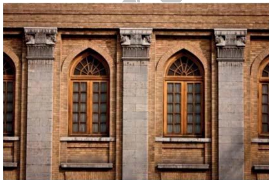
تصویر شماره ۲۲: تلفیق نیم ستون‌ها و سرستون‌های هخامنشی با قوس‌های جناغی دوره اسلامی در ساختمان اداره پست