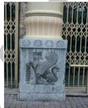
تصویر شماره ۸: نقش برجسته (زُرت، گریفین، نیلوفر) به کار رفته پایه ستون ساختمان شرکت سهامی فرش