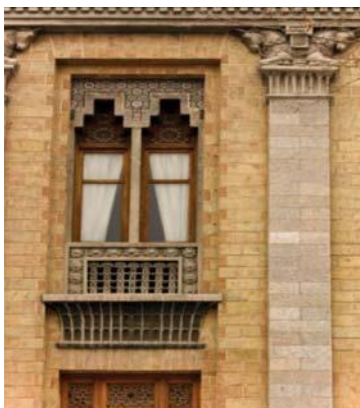
تصویر شماره ۶: سرستون، نعل درگاه، کنگره به کار رفته در بنای وزارت امور خارجه با تقلید از عناصر معماری هخامنشی

۲. عناصر تزئینی نظیر نقوش برجسته، حجاری‌ها، مجسمه‌ها و کنگره‌ها (تصاویر شماره ۷ تا ۱۰) در اقتباس از این آثار، هیچ‌گاه پلان و یا عملکرد خاص آن معماری مورد استفاده قرار نگرفت. طاق کسرای ساسانی برای موزه‌ها، و ستون‌های تخت جمشید برای بانک و بناهای اداری و نظامی به کار گرفته شد؛ به عبارتی آنچه در ظاهر بیشترین تأثیر را می‌توانست القا کند در سطح وسیعی مورد استفاده قرار گرفت. اما این انتخاب چگونه انجام می‌شد؟ «در دوران پهلوی اول، هنرمندان معماری ایرانی و غربی که سازنده بناهای دولتی و