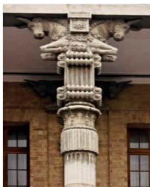
تصویر شماره ۱: سرستون به کار رفته در بنای وزارت امور خارجه (کاخ شهربانی سابق) با تقلید از سرستون‌های تخت جمشید

۱. عناصر مشخص معماری در بناها نظیر ستون‌ها، پایه ستون‌ها، پنجره‌ها، پلکان، ورودی‌ها، قوس‌ها و دهانه‌ها (تصاویر شماره ۱ تا ۶).