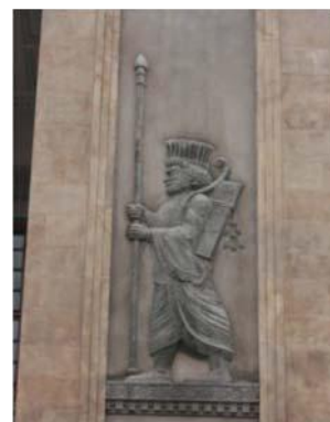
تصویر شماره ۱۰: نقش برجسته (سرباز هخامنشی) به کار رفته در بنای بانک ملی