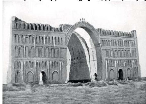
تصویر شماره ۲۷: تاق کسری ساسانی واقع در تیسفون (عراق امروزی)