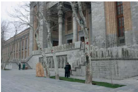
تصویر شماره ۴: پلکان ورودی ساختمان وزارت خارجه (کاخ شهربانی سابق) با پلکان دو طرفه تخت جمشید