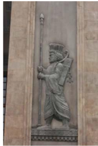
تصویر شماره ۱۸. نقش برجسته سرباز هخامنشی در بنای بانک ملی

شرکت سهامی فرش ایران در سال ۱۳۱۴ با دستور دولت وقت احداث شد. قدمت این ساختمان متعلق به اواخر قاجاریه و اوایل