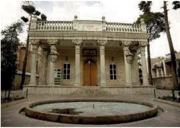
تصویر شماره ۲۰: مدرسه فیروز بهرام (۱۳۱۱ ه.ش) توسط جعفر خان معمار باشی طراحی شد. استفاده از ایوان ورودی، ستون‌ها و سرستون‌ها با تقلید از معماری هخامنشی