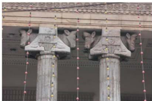
تصویر شماره ۱۷: ستون‌ها، سرستون‌ها و تزیین‌های گل نیلوفر با تقلید از معماری هخامنشی بانک ملی