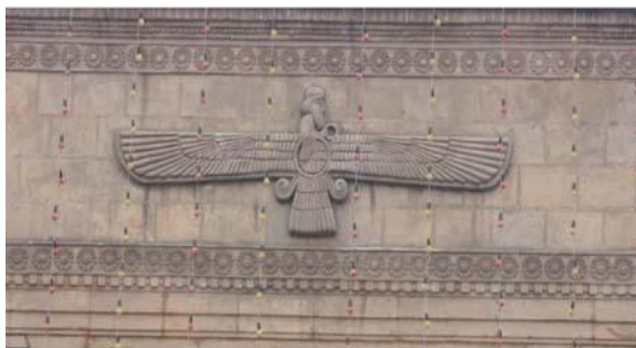
تصویر شماره ۱۱: استفاده از نقش فروهر در ساختمان بانک ملی

«ساختمان بانک ملی ایران که در سال ۱۳۰۹ ساخته شد، برای نخستین بار معماری باستانی ایران و معماری اروپا را در یک جا عرضه کرد. در این بنا نقش فروهر دوباره پس از ۲۵۰۰ سال مورد استفاده قرار گرفت.» (رجبی، ۱۳۵۵: ۴۲) (تصویر شماره ۱۱).