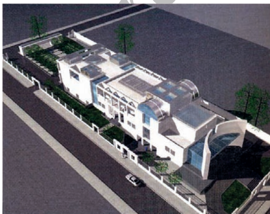
تصویر شماره ۷: سفارت ایران در برلین، طراحی داراب دیبا از نمونه‌های آثار شاخص در معماری پس از پیروزی انقلاب اسلامی محسوب می‌شود که در آن از ایده‌های فضای معماری سنتی استفاده شده است. (منبع: مهدوی‌نژاد، ۱۳۸۵)