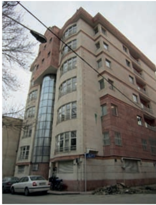
تصویر شماره ۵: مرکز مطالعات و برنامه‌ریزی شهر تهران، دهه ۱۳۸۰، تهران، الهیبه