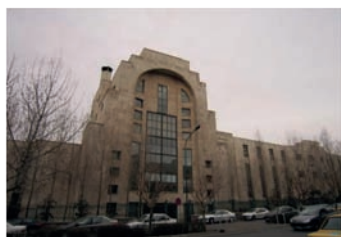
تصویر شماره ۲: دانشکده فنی دانشگاه تهران، دهه ۱۳۷۰، امیرآباد تهران، نمونه‌ای از بناهای عملکردگرایانه دوران مدرن که با استفاده از مصالحی مانند سنگ و با فرم پست‌مدرن تکمیل شده است.