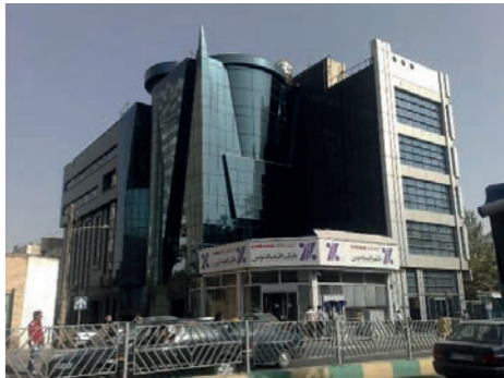
تصویر شماره ۸: بانک اقتصاد نوین در میدان ونک در مجاورت مجموعه‌ای برخوردار از نوعی معماری تنش‌زا و ساختارزدایی شده

ترتیب عبارتند از: ۱- متجانس (هماهنگ با محیط)، ۲- متقابل (بی تفاوت)، ۳- متضاد (خردمندان - سهل انگارانه) و ۴- معماری یادمانی (مونومانتال).