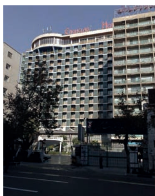
تصویر شماره ۳: هتل انقلاب واقع در خیابان طالقانی تهران، نمونه‌ای از بهره‌گیری از الگوهای معماری مدرن سبک بین‌الملل در دهه ۱۳۶۰