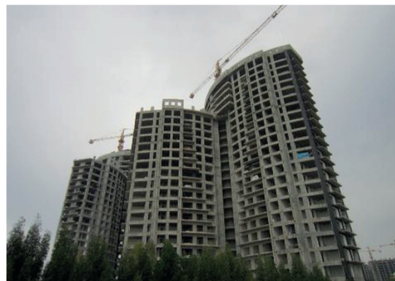
تصویر شماره ۴: شرکت انبوه‌سازان همای تهران، پروژه مسکونی برج‌های دوقلوی کیش، دهه ۱۳۸۰

برای بررسی فراگیر در زمینه معماری معاصر لازم است بناها با شیوه‌ای کارآمد انتخاب شوند تا بتوانند نمونه موردی موفق و قابل اعتنایی محسوب گردند. معیار انتخاب نمونه‌ها به این صورت است که: ۱- بناهایی که در تحلیل‌های مطرح شده از سوی منتقدان معماری معاصر ایران به آن‌ها اشاره شده است. ۲- بناهایی که در نشریه‌های تخصصی معماری مورد نظر قرار گرفته‌اند. ۳- بناهایی که در سطح کلان مطرح و یا در مسابقه‌های حائز مقام بوده‌اند. ۴- بناهایی که در برداشت‌های میدانی حاوی ویژگی مورد توجه‌ای بودند و در دستیابی به داده‌هایی در جهت تکمیل ماتریس مورد استفاده قرار می‌گرفتند. بسیاری از بناهای انتخاب شده، با هدف ترسیم شمای کلی از جریان‌های تجدیدحیات‌گرایانه در معماری معاصر ایران تهیه شدند و در مراحل بعدی به فراخور موضوع، می‌توان بناهایی اضافه و یا حذف کرد. برای انجام پژوهش، دویست بنا به روش نمونه‌گیری تصادفی به عنوان نمونه اولیه و پنجاه اثر به عنوان نمونه نهایی انتخاب شده‌اند.