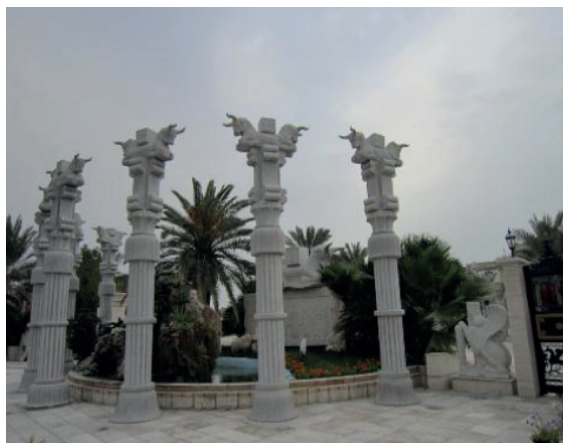
تصویر شماره ۶: هتل بین‌المللی داریوش، نمونه‌ای از کاربرد کهن‌الگوهای مربوط به معماری هخامنشی در معماری معاصر ایران در دهه ۱۳۷۰، جزیره کیش

در نهایت برای ارتقای هر چه بهتر تجزیه و تحلیل موردی، مجموعه‌ای از واژگان کلیدی طرح‌های مختلف گردآوری شدند. پس از گردآوری این واژه‌ها، واژه‌هایی که می‌توانستند از تأویل‌های گوناگونی برخوردار باشند، با تعریفی واحد و یا با مشخص نمودن شاخصه‌هایی معین، باز تعریف شد. در مرحله بعد، واژه‌ها در طبقه‌بندی‌هایی قرار داده شدند تا سطح اطلاعاتی که در تحلیل‌های بعد مورد استفاده قرار می‌گیرند، مشخص شوند. بر این مبنا چهار موضوع اصلی و یک موضوع فرعی، پنج رده اصلی طبقه‌بندی داده‌ها را به وجود آوردند که هر یک دارای زیرمجموعه‌های مرتبط با خود هستند. زیرمجموعه‌های مذکور نیز در صورت نیاز به بسط بیشتر به زیرمجموعه‌های کوچک‌تری تقسیم شدند که به طور عمده در برگزیده واژه‌هایی هستند که در تبیین مفهوم مطرح شده به کار رفته‌اند. به عنوان مثال زمانی که از واژه یا اصطلاح «معماری مدرن» در ماتریس طبقه‌بندی استفاده می‌شود، در لایه بعدی به واژه‌هایی مانند: بروتالیسم، شکستن جعبه و عملکردگرایی اشاره گردیده تا شاخصه‌هایی که در بناها برای شناسایی معماری مدرن به کار گرفته شده‌اند، معین شوند. این موضوع در ارتباط با دیگر موارد نیز رعایت شده است.