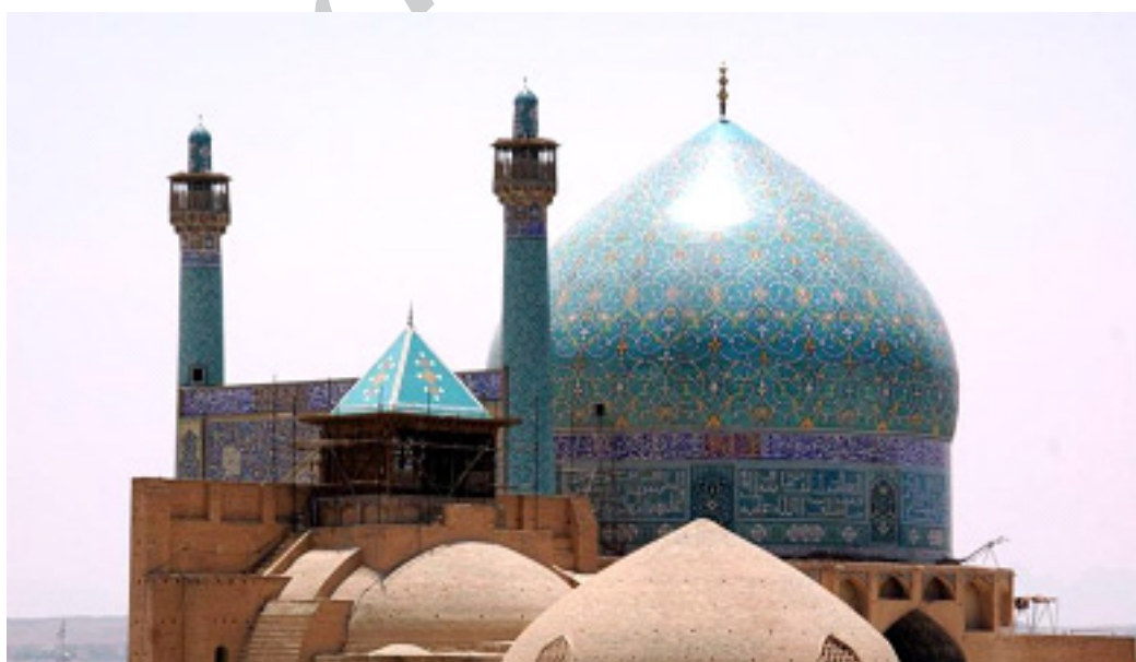
تصویر شماره ۱: گنبد مسجد امام اصفهان

در این مقاله بر پایه تفکیک گزاره‌های حقیقی و اعتباری و مسائل بالقوه وجودی (قطعی) و بالفعل انسانی (نسبی)، به تبیین برخی دیگر از مسائل منبعت از چگونگی این تفکیک نظیر رابطه صورت (کالبد آثار معماری) و محتوا (بطن فرهنگی) از منظر اسلامی می‌پردازیم.