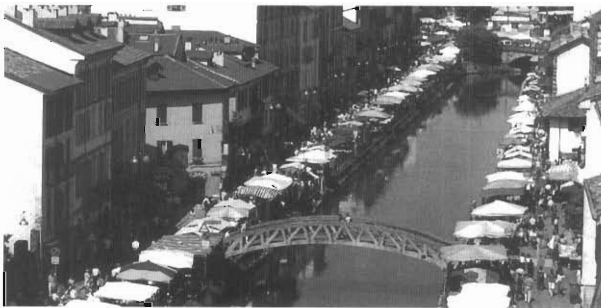
● میلان - بازار روزی در کنار نهر