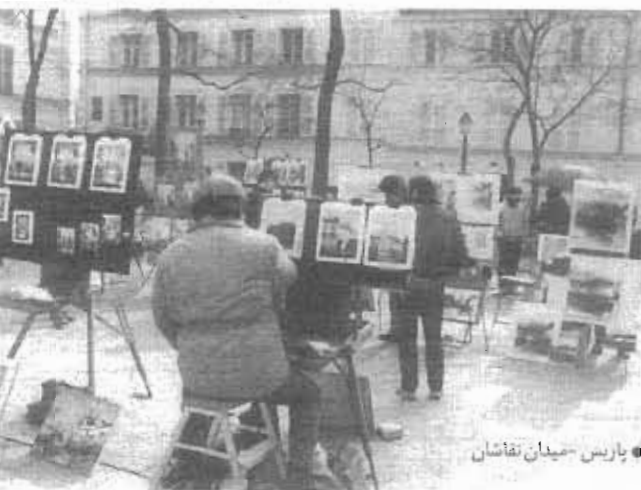
● پاریس - میدان نقاشان