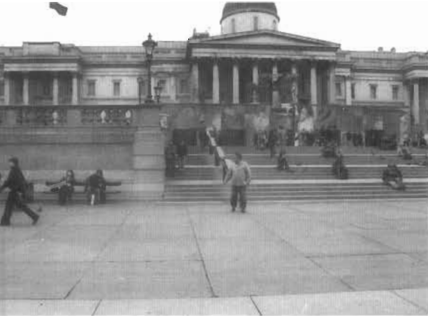
● لندن - میدان ترافالگار