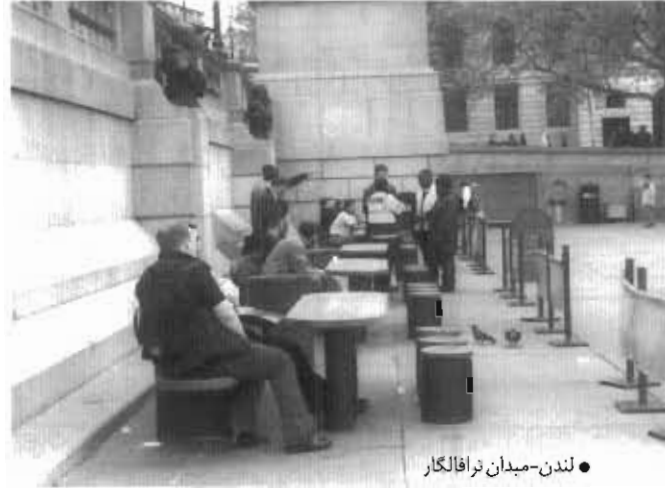
● لندن- میدان ترافالگار