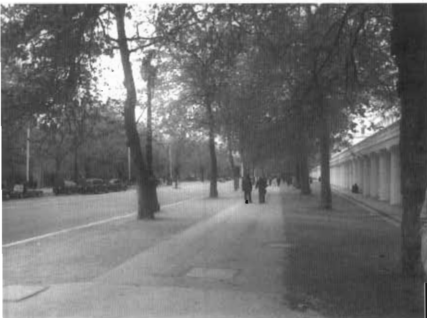
● لندن- خیابان The Mall

از حدود ۱۱ هزار کارمند شهرداری کلان شهر مشهد با آن همه توریست و گردش گر، تنها کمتر از ۵ نفر دانش آموخته ی طراحی شهری اند!