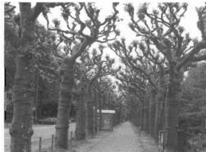
● فرانکفورت - پیاده روی حاشیه ی رودمان

همراه با توسعه ی اجتماعی و کالبدی شهرها به ویژه تهران و رشد جمعیت آن، پدیده ی بیلاق نشینی و گسترش فضاهای سبز و تفریحی نیز رو به گسترش نهاد. در تحولات دوره ی ناصری، سیاست باغ سازی و ایجاد پارک به شیوه ی اروپایی نیز رواج یافت. نخستین پارکی که به سبک ایرانی - اروپایی در تهران ساخته شد، باغ و قصر "دوشان تپه" بود که در شرق تهران قرار داشت. هم چنین به روایت جعفر شهری در کتاب