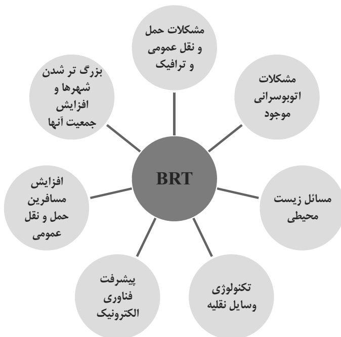
شکل ۱. عوامل موثر شکل گیری سیستم BRT؛ ماخذ: عمران زاده، ۱۳۸۸.