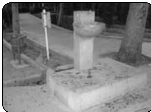
نمایی از آبخوری با طراحی نامناسب؛ به ارتفاع زیاد و سکوی پلکانی توجه شود.