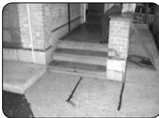
نمایی از ورودی‌های نامناسب و غیر کاربردی سرویس‌های بهداشتی جهت معلولان