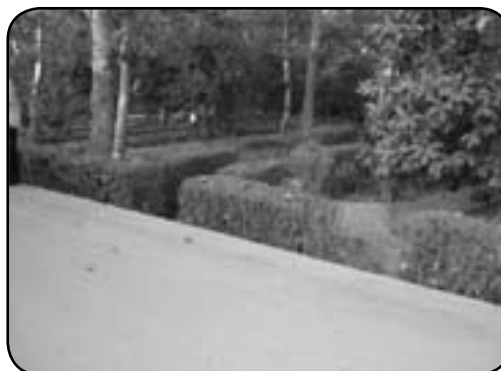
کاربرد جدول با حداقل ارتفاع ۵ سانتیمتر در کناره مسیرهای حرکتی