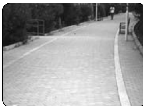
جنس مناسب کفیوش و بستر سخت و غیرلغزنده در پارک لاله