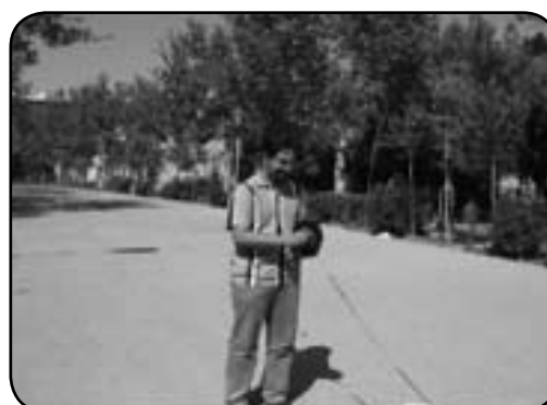
(تصویر شماره ۴) اندازه‌گیری شیب در مقطع نگارخانه تا لوازم بدنسازی