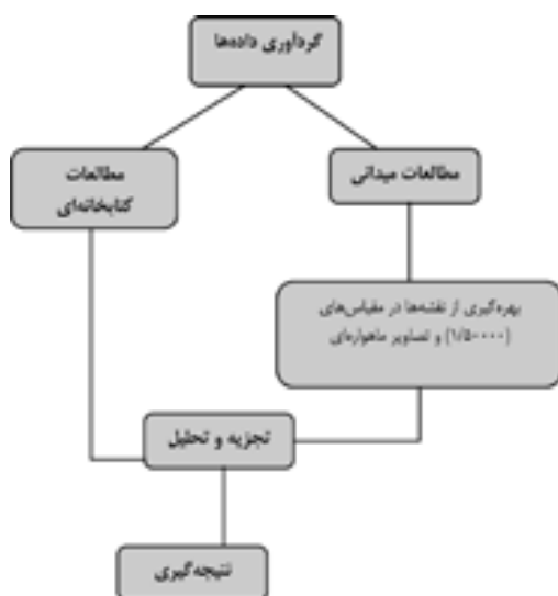
(نمودار شماره ۲) نمودار گردش کار و چرخه مطالعاتی

در قالب مجموعه ضوابط و مقررات شهرسازی و معماری برای معلولین جسمی - حرکتی مصوبه مورخ ۸/۳/۱۳۶۸ همچنین شورایی عالی شهرسازی و معماری ایران) می‌گردد. همچنین در برخی موارد، به منظور افزایش دقت مطالعات، از ضوابط و استانداردهای موجود در منابع خارجی نیز بهره گرفته شده است. ۶