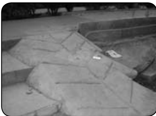
شیب زیاد و طراحی نامناسب جهت حرکت ویلچر