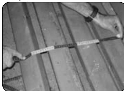
رعایت ارتفاع و عرض مناسب در طراحی مبلمان پارک