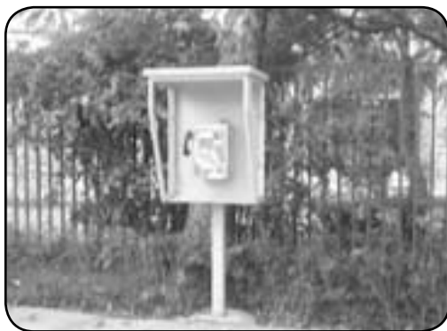
ابعاد نامناسب تلفن عمومی با ارتفاع ۱۲۰ سانتیمتری