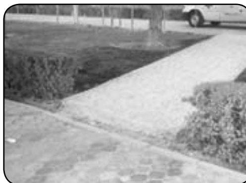
قطع مسیر حرکتی و عدم رعایت یکدستی در محورها