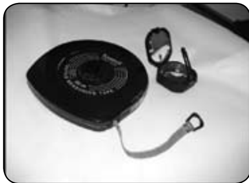
(تصویر شماره ۳) تجهیزات مورد استفاده جهت اندازه‌گیری شیب در پارک لاله