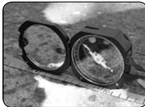
(تصویر شماره ۲) بهره‌گیری از کمپاس مدل به همراه متر جهت اندازه‌گیری شیب