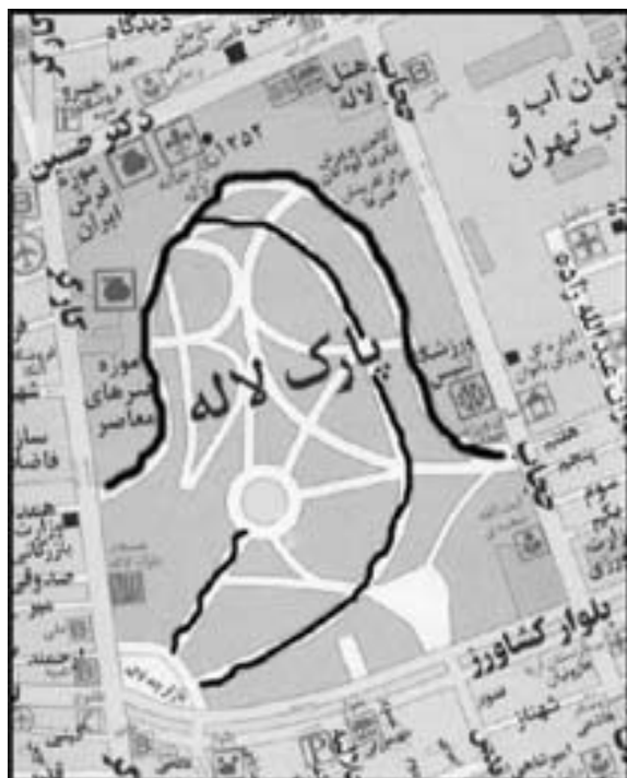
(تصویر شماره ۶) موقعیت محورهای اصلی و فرعی پارک لاله