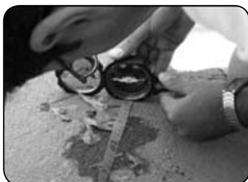
(تصویر شماره ۵) اندازه‌گیری شیب در مسیرهای اصلی و فرعی پارک لاله