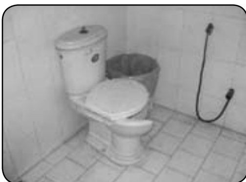
نمایی از توالت شکسته و غیر قابل استفاده ویژه معلولان در بخش مرکزی پارک لاله