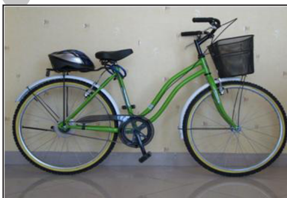
تصویر ۲: نمونه‌ای از دوچرخه‌های طرح که دارای سبد نیز هستند

ارزشیابی شده است؛ متأسفانه این ارزشیابی‌ها در دسترس نیستند. ظاهراً جهت طرحهای دوچرخه قبلی تهران (نه الزاماً دوچرخه اشتراکی) که با شکست مواجه شده‌اند مطالعه مستقلی انجام