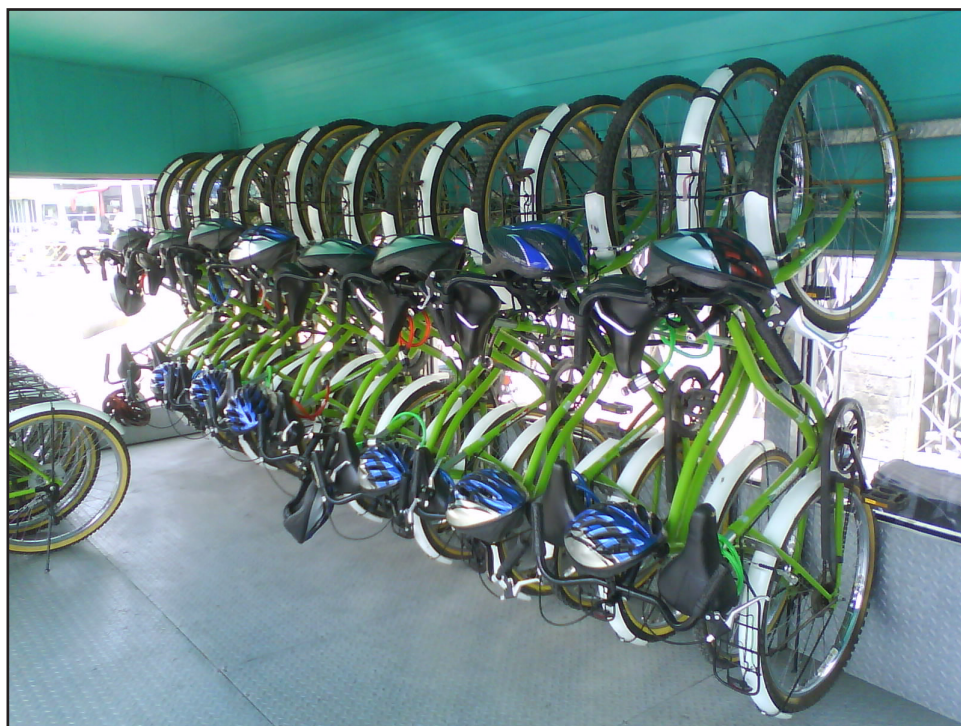
تصویر ۱: نمونه‌ای از خانه‌های دوچرخه