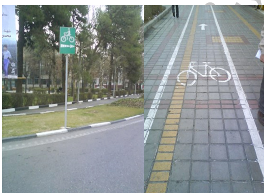
تصویر ۳: نمونه‌ای از مسیرهای دوچرخه و علائم راهنمایی